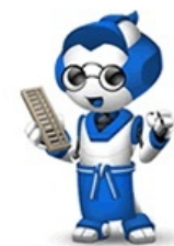
マスコット ロボでっち